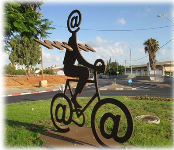
The Internet Messenger by Buky Schwartz

1 a What was your first wide search on the Internet? _____